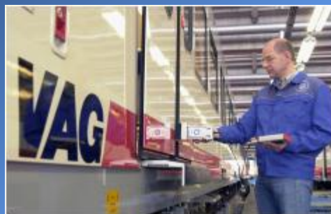
Департамент «Менеджмент Сервис»