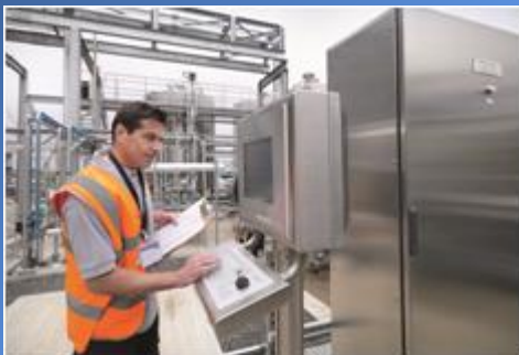
Департамент «Индустри Сервис»