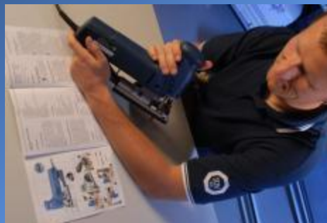
Департамент «Продакт Сервис»