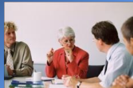
Департамент «Обучение и консультации»