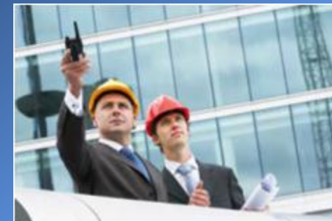
Департамент «Реал Эстейт»